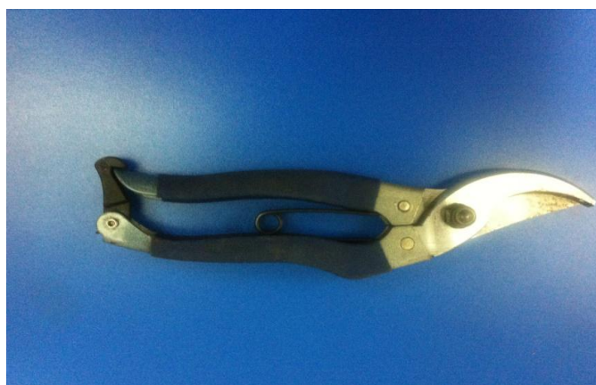
种植类嫁接技术项目中所使用的枝剪