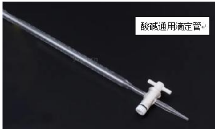
养殖类牛奶酸度测定项目中的碱式滴定管