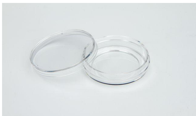
种植类种子活力测定项目中所使用的培养皿