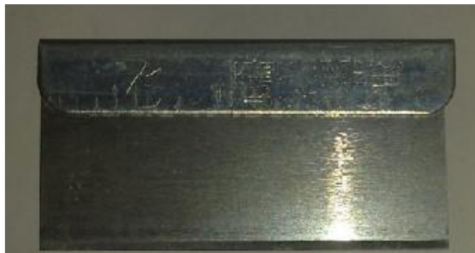
种植类种子活力测定项目中所使用的单面刀片