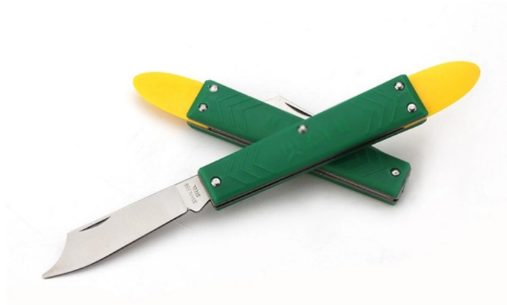
种植类嫁接技术项目中所使用的芽接刀