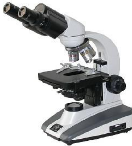
技能操作考试各项目中使用显微镜